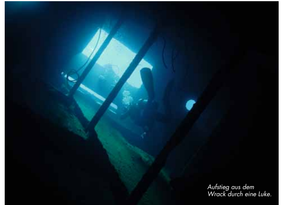
Aufstieg aus dem Wrack durch eine Luke.