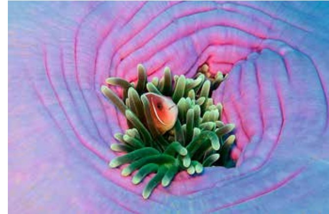
1. Rang Anemonen-Fische