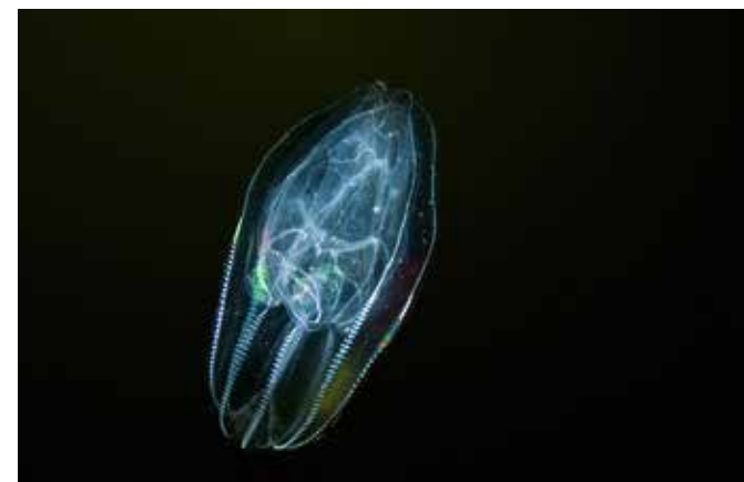
1. Rang Quallen

Kamera: Nikon D 90 Bildbewertung: 18,44 Punkte