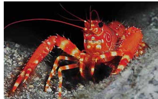
1. Rang Krebstiere

Kamera: Canon G 10 Bildbewertung: 17,36 Punkte