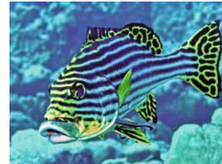
Süsslippe mit Putzerfisch