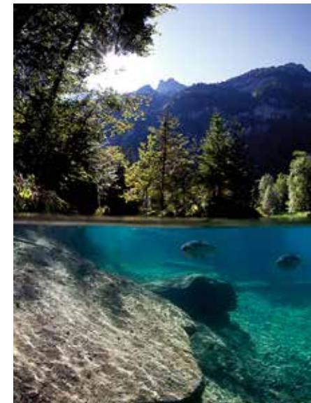
Bergsee halb/halb