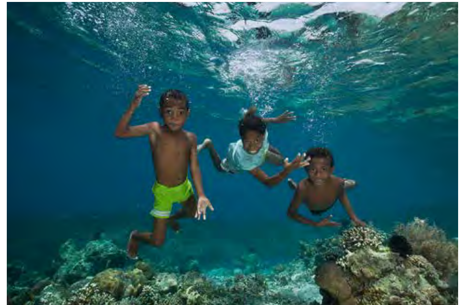
Keine Berührungs- ängste mit dem Meer: Die Kinder vom Dorf Arborek in Raja Ampat (Indonesien).

re gemeinsam mit meiner Fototechnik entwickelt. Während ich zu Beginn viele Einzelmotive ins Rampenlicht rückte, gelang es mir bald auch ganze Unterwasserszenen festzuhalten. Dann rückte die Weitwinkelfotografie in den Fokus. Aktuell beschäftigt mich die Optimierung von Mischlichttechniken, mit denen es möglich wird, meine aktuellen Reiseziele in West