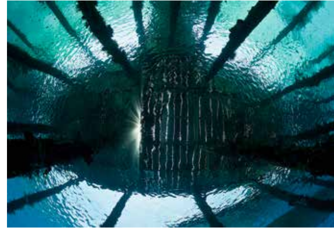
Einfacher Bootsanle- ger aus besonderer Perspektive: Mit Sonnenstrahlen, die sich förmlich durch die Abdeckung drücken.

re gemeinsam mit meiner Fototechnik entwickelt. Während ich zu Beginn viele Einzelmotive ins Rampenlicht rückte, gelang es mir bald auch ganze Unterwasserszenen festzuhalten. Dann rückte die Weitwinkelfotografie in den Fokus. Aktuell beschäftigt mich die Optimierung von Mischlichttechniken, mit denen es möglich wird, meine aktuellen Reiseziele in West