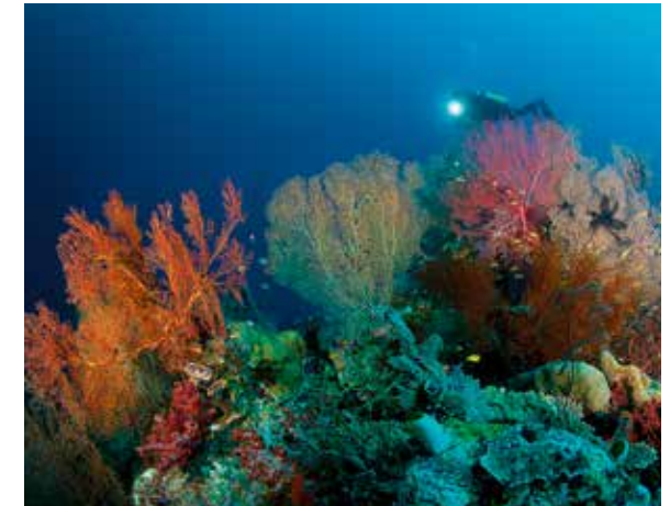
Riesige Fächerkorallen, die in der nährstoffreichen Strömung der Rifffkante wehen.