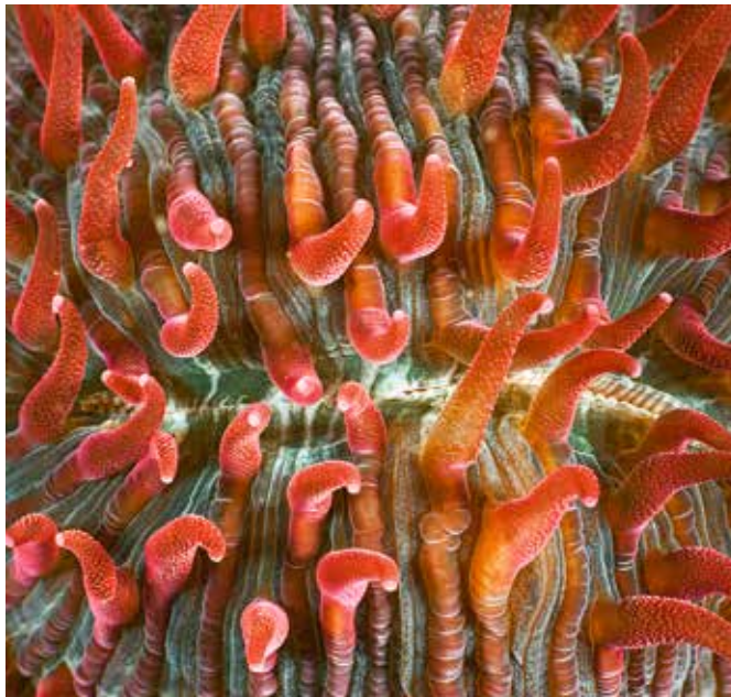
Ganz nah: Anemone in 3D.

Es ist bereits mehr als ein Vierteljahrhundert her, seit ich zum ersten Mal den Auslöser einer Kamera gedrückt habe. Die ersten Schritte als angehender Fotograf durfte ich im renommierten Fotoclub Aarso machen, wo meine Leidenschaft erkannt und gefördert wurde. Mit Beginn meiner Tauchkarriere war die Erweiterung meiner Passion auf die Unterwasserwelt nur eine Frage der Zeit. Rasch wurde mir klar, dass unter Wasser andere Spielregeln gelten als auf dem Land – und genau diese Herausforderung hat mich zusätzlich zum Wunsch, die Unterwasserwelt im Bild festzuhalten, fasziniert. Getrieben von ersten spärlichen Erfolgen war ich motiviert, mir durch Workshops bei den ganz Grossen der Unterwasser-Fotografie zusätzliches Know-how zu holen. Mit immer besseren Bildern im Gepäck wuchs auch das Bedürfnis nach einer ausgereifteren Bearbeitung der Digitalbilder. So tauchte ich einen Winter lang in die digitale Welt von Adobe ab, um