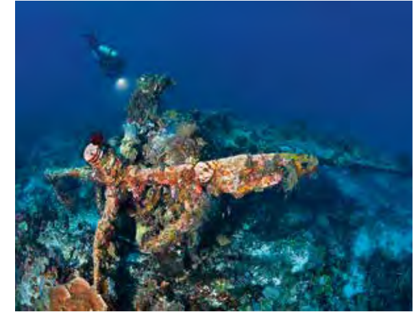
Flugzeugwrack einer P47 Thunderbolt aus dem Zweiten Weltkrieg in ca. 40 Meter Tiefe in der Nähe von Biri Island, Raja Ampat (Indonesien).

In all den Jahren ist einiges an Bildmaterial zusammengekommen, und es freut mich natürlich riesig, dass ich dieses in kleineren und grösseren Ausstellungen oder bei Vorträgen einem breiten Publikum zugänglich machen kann. Zudem habe ich natürlich dem Zeitgeist entsprechend einen kleinen Online-Shop mit ein paar ausgewählten Bildern, die ich laufend bzw. wenn ich die Zeit dafür finde, aktualisiere. Es fehlen noch viele, also packen wir's an!