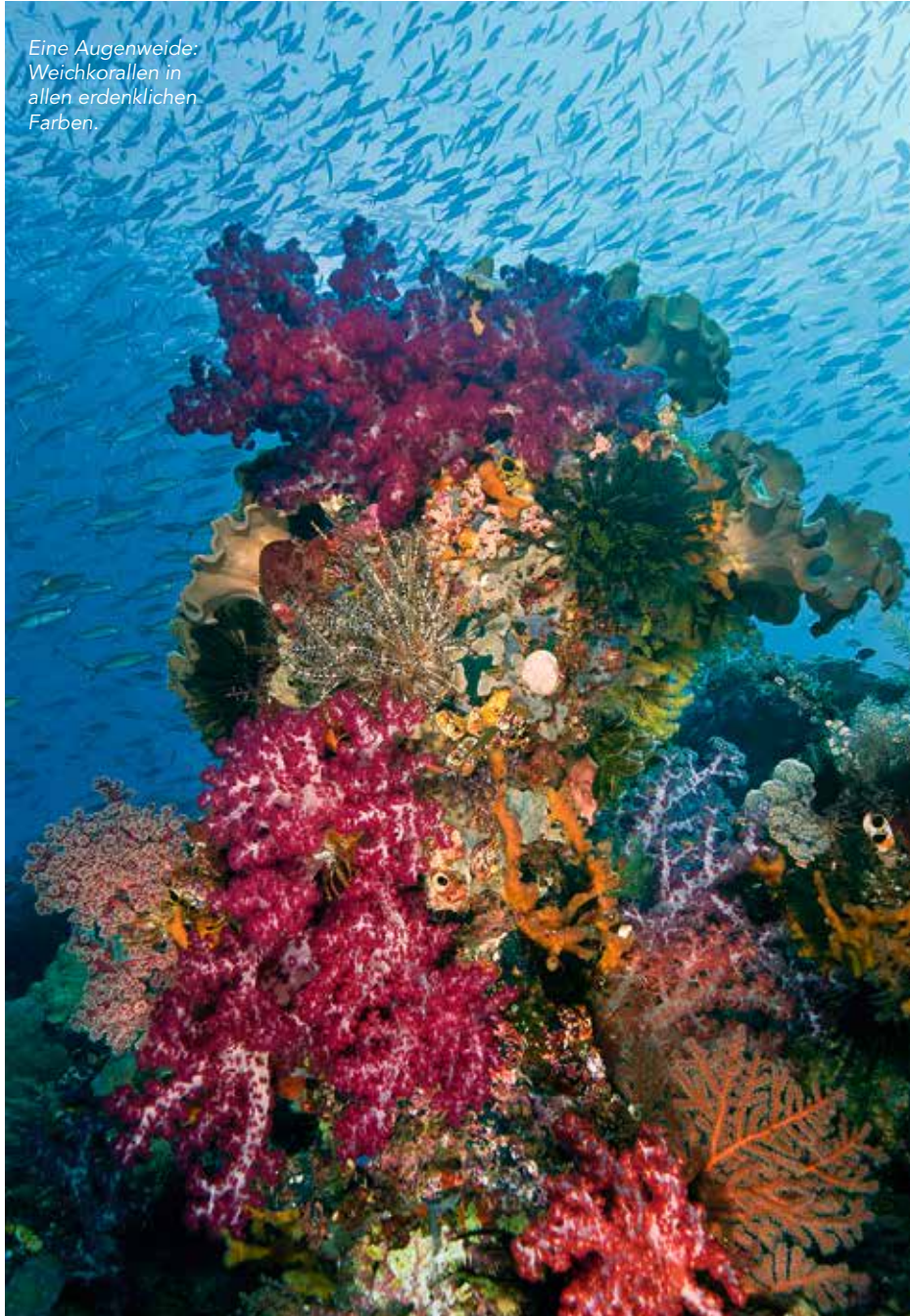
Eine Augenweide: Weichkorallen in allen erdenklichen Farben.