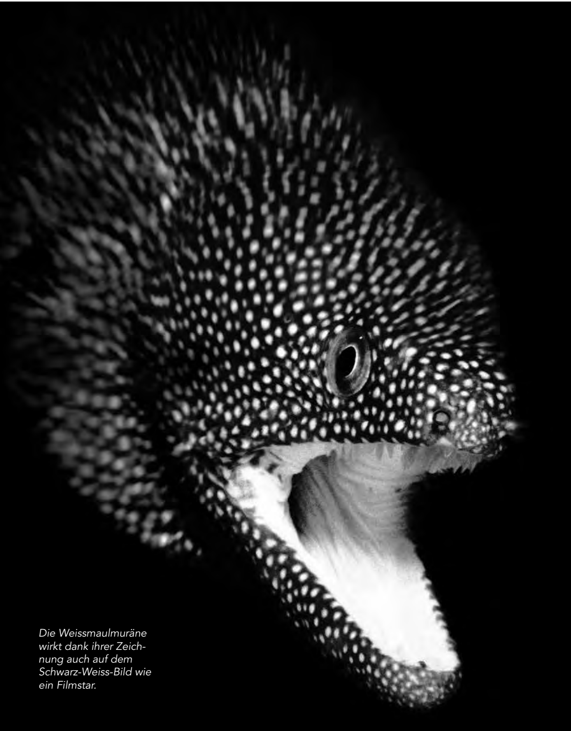
Die Weissmaulmuräne wirkt dank ihrer Zeichnung auch auf dem Schwarz-Weiss-Bild wie ein Filmstar.

Ambrosone geben würde – sind immer auf der Suche nach Natur pur – über wie unter Wasser. Entsprechend wäre nach vielen Tauchgängen in Ägypten, der Karibik, auf den Malediven, in Indonesien, Thailand und im Mittelmeer der Osten von Papua Neuguinea eine nächste Wunschdestination. Beim Gedanken daran entstehen bereits erste Skizzen in meinem Kopf, die ich hoffentlich bald verwirklichen kann.